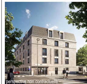
perspective non contractuelle