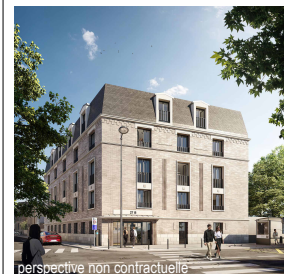
perspective non contractuelle