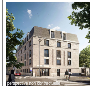
perspective non contractuelle