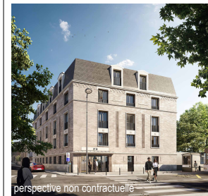
perspective non contractuelle